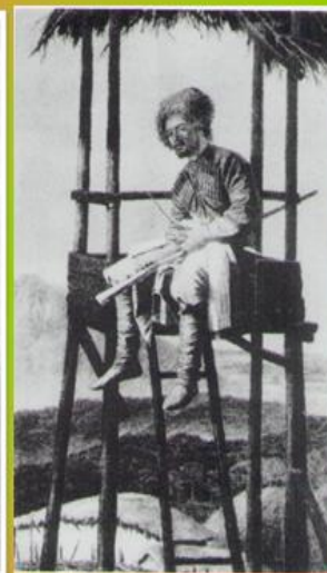
Кзаки на сторожевой вышке