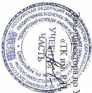
ГРАФИК передачи академической задолженности на экономико-юридическом отделении за 2 семестр 2023-2024 учебного года