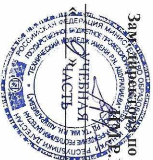
ГРАФИК передачи академической задолженности на отделение «Программирование» за II -й семестр 2023/2024 г.