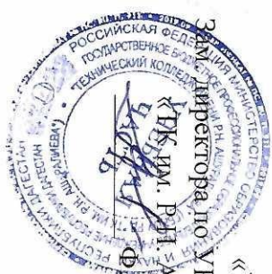
ГРАФИК пересдачи академической задолженности на экономико-юридическом отделении за 2 семестр 2023-2024 учебного года