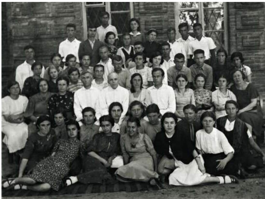
Выпускники школы № 13

По примеру ленинградцев и москвичей, махачкалинцы добровольно вступали в отряды народного ополчения. Первые отряды народного ополчения были созданы в махачкалинском морском порту, на фабрике им. III Интернационала. На 10 августа 1941 г. поступило 3571 заявление о зачислении в народное ополчение, из которых были сформированы: стрелковый полк, 3 отдельных батальона и одна специальная рота. Осенью 1942 г. в Махачкале создаются еще 5 отрядов народного ополчения. 24 октября 1941 г. был создан Махачкалинский Комитет Оборона.